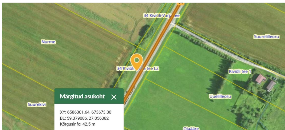
Joonis 1. Riigitee nr 34 km 5,61 (vasakul pool), väljavõte Maa-ameti geoportaalist

Tuginedes liiklusseaduse § 7 1 lg 2 alusel kehtestatud majandus- ja taristuministri määruse „Tähistatavate teede liigid, juhatus- ja teeninduskohamärkide paigaldamise kord ning sihtpunktidele viitamise süsteem“ § 2 ja 9 sätetele ning esitatud taotlusele kooskõlastame bussipeatuste asukohad, ootealade ehitamise ja liiklusmärkide 541a paigaldamise riigitee nr 13178 km 0,725 (paremal) ning nr 34 km 5,61 (vasakul, Joonis 1) ja km 5,64 (paremal, Joonis 2) järgmistel tingimustel.